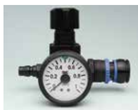
圧力調整用キット。 両端カプラと減圧弁をセット。

注) BIM**04タイプのノズルをご利用時は、圧力コントロールのためこちらが必要になります。