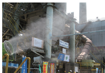
工場敷地 (熱暑・粉塵対策)