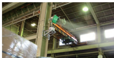
工場内(熱暑・粉塵対策)