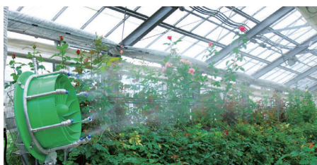
植物ハウス(熱暑・乾燥対策)