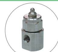
2流体ノズル CBIMVシリーズ