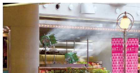
商業施設(熱暑対策)