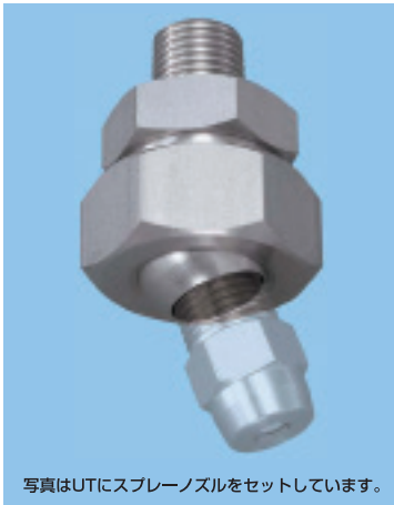
写真はUTにスプレーノズルをセットしています。