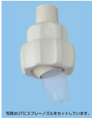
写真はUTにスプレーノズルをセットしています。