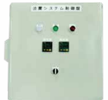
写真の製品は制御盤 F-TH です。