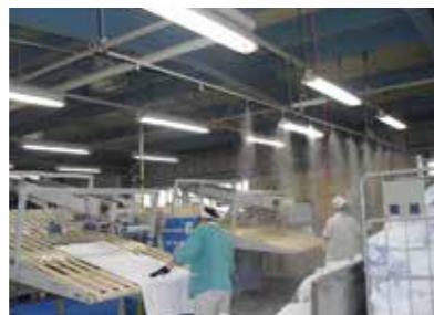
株式会社東基 埼玉工場様