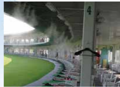
光成ゴルフアリーナ様