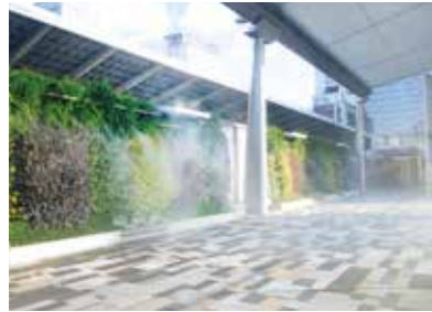
JR東京駅八重洲口 グランルーフ様