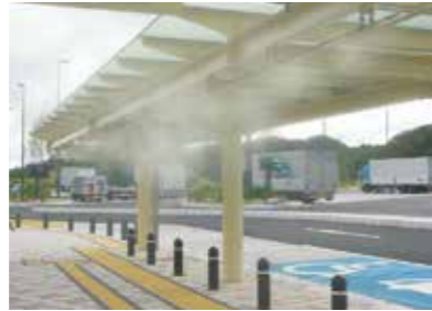
新東名高速道路 掛川IPA休憩施設様