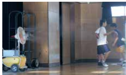
屋内(体育館)(熱暑対策)