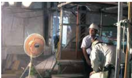
屋内(休憩所)(熱暑対策)