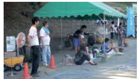
屋外(仮設テント)(熱暑対策)