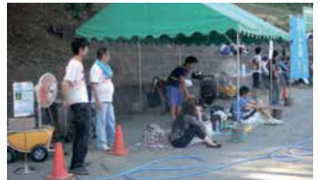
屋外(仮設テント)(熱暑対策)