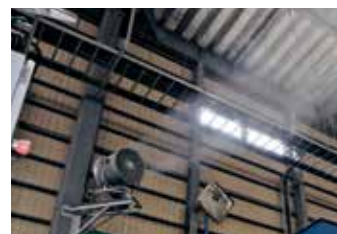
廃棄物処理場 (熱暑・粉塵対策)