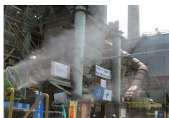
工場敷地(熱暑・粉塵対策)