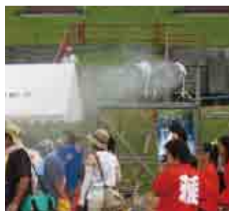
熱暑対策 イベント