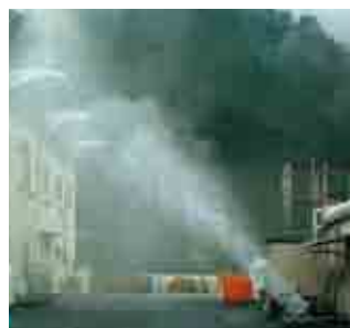
熱暑対策 工場敷地