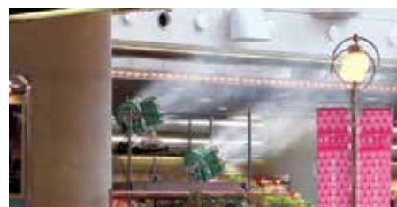
商業施設(熱暑対策)